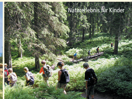
Naturerlebnis für Kinder