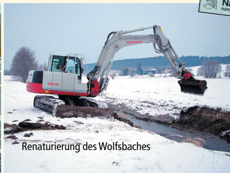
Renaturierung des Wolfsbaches