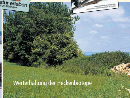
Werterhaltung der Heckenbiotope