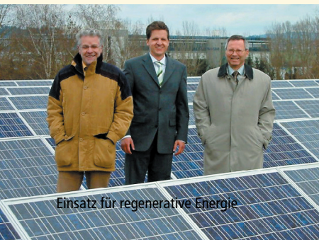
Einsatz für regenerative Energie

Das Umweltbüro begleitet das kommunale Energiemanagement und macht Vorschläge für Einsparmaßnahmen und effizienteren Energieeinsatz. Dadurch konnten die Energieverbräuche in städtischen Liegenschaften deutlich reduziert werden. Im Rahmen eines umfassenden Klimaschutzkonzeptes wurden Beleuchtungsanlagen, Pumpwerke und kommunale Gebäude unter die Lupe genommen. Es werden Impulse gegeben für effizientere Biogasnutzung, den Ausbau von Nahwärmenetzen und Altbausanierungen. Außerdem wird der Ausbau der regenerativen Energien unterstützt. Mit der kommunalen Wärmeplanung und der Arbeit für eine klimaneutrale Kommunalverwaltung wird die Energiewende vorangetrieben.