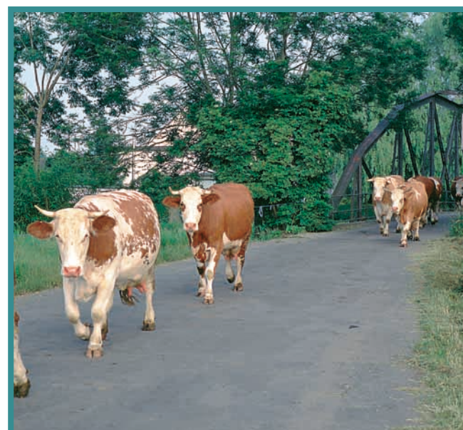
Kühe beim täglichen Weidegang in Allmendshofen