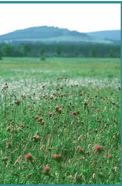
Naturerlebnis an der jungen Donau