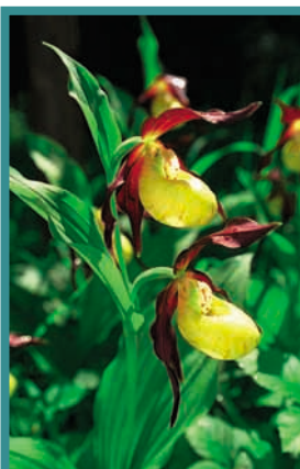
Eine seltene Orchidee: Der Frauenschuh

Verkehrsamt der Stadt Bräunlingen Rathaus, 78199 Bräunlingen Tel. 0771/603-144 Fax 0771/603-169