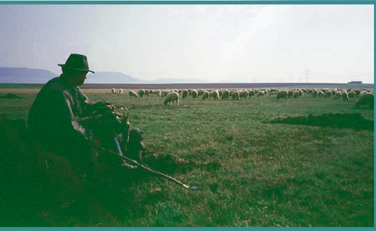
Ein Schäfer auf dem Weg vom Südschwarzwald zur Schwäbischen Alb